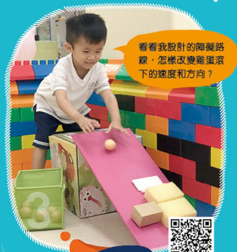
不准滾蛋 幼兒班《約克的彩蛋》