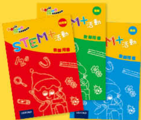
STEM+ 活動 教師用書