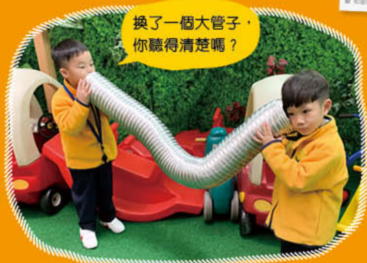
例子：幼兒班《哪裏來的怪聲音？》