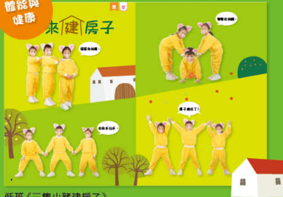
低班《三隻小豬建房子》