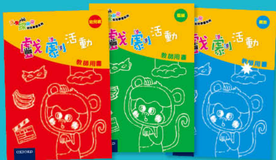
戲劇活動 教師用書