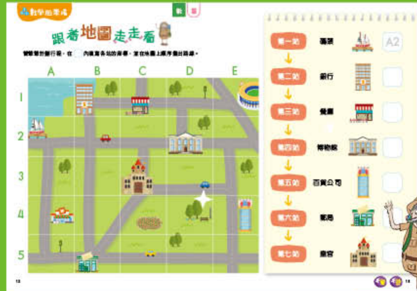
高班《爺爺遊烏龍國》