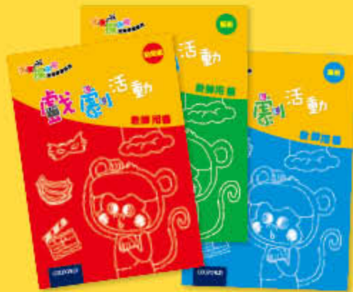
戲劇活動 教師用書