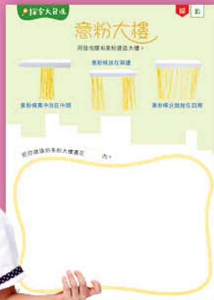
低班《三隻小豬建房子》