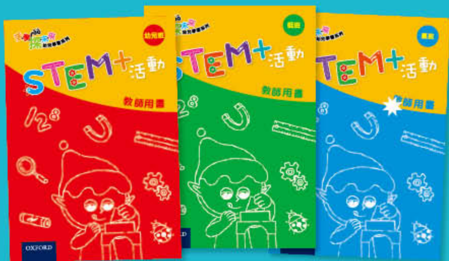
STEM+ 活動 教師用書