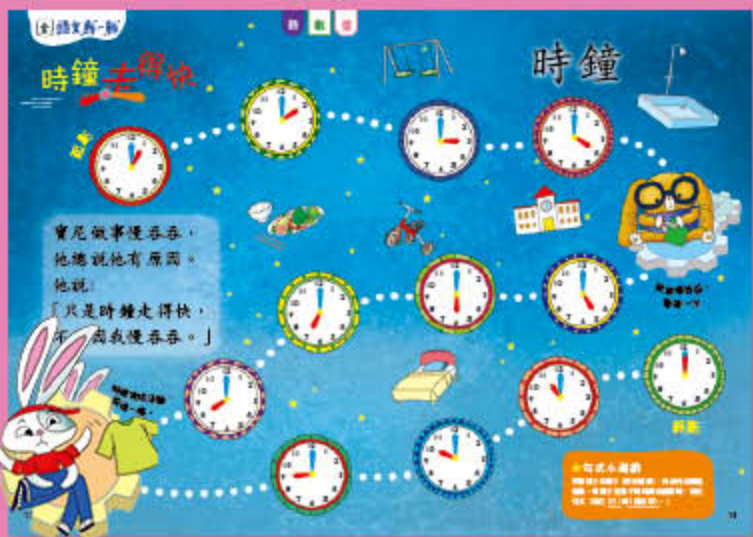
高班《慢吞吞的寶尼和急匆匆的邦尼》