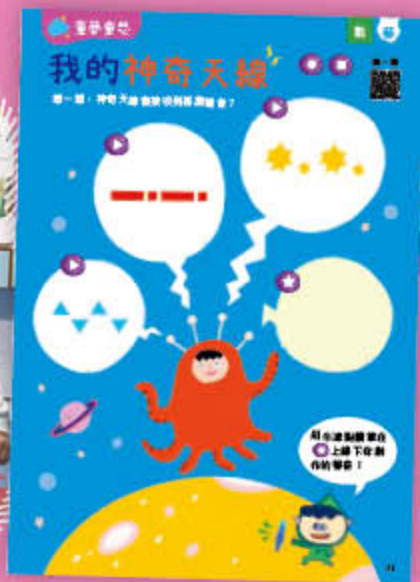
幼兒班《哪裏來的怪聲音？》