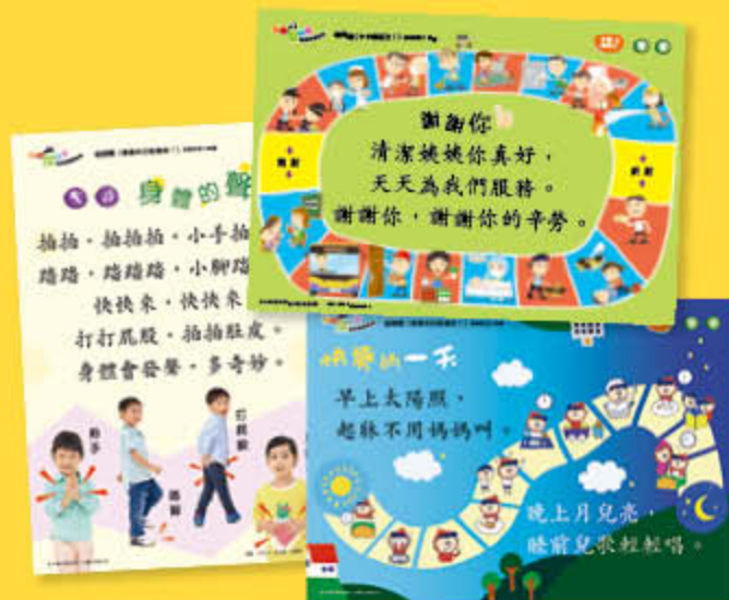
發聲歌曲大掛圖、發聲兒歌大掛圖