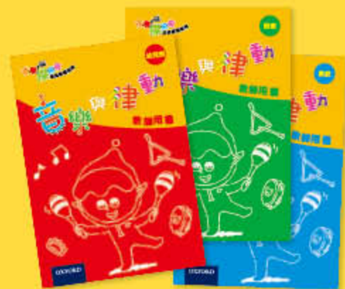
音樂與律動 教師用書