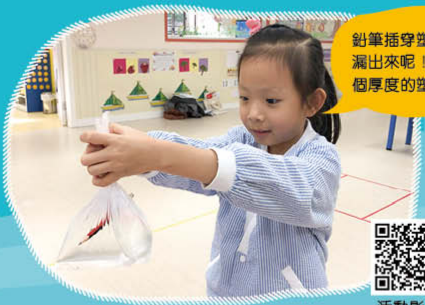
神奇的塑膠袋 高班《紅黃藍白》