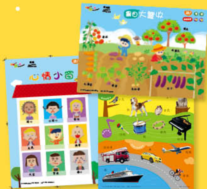
發聲遊戲大掛圖、發聲主題大掛圖