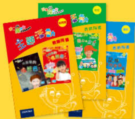
主題活動 教師用書