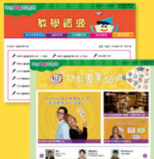
教學資源網、幼教專業頻道