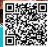
幼教奇趣課室 音樂劇