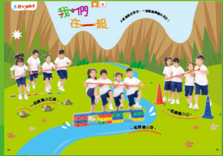
高班《鼠族世界會議》