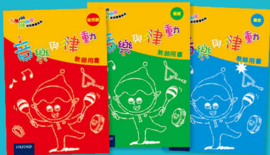
音樂與律動 教師用書