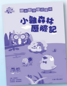
繪本教學使用手冊