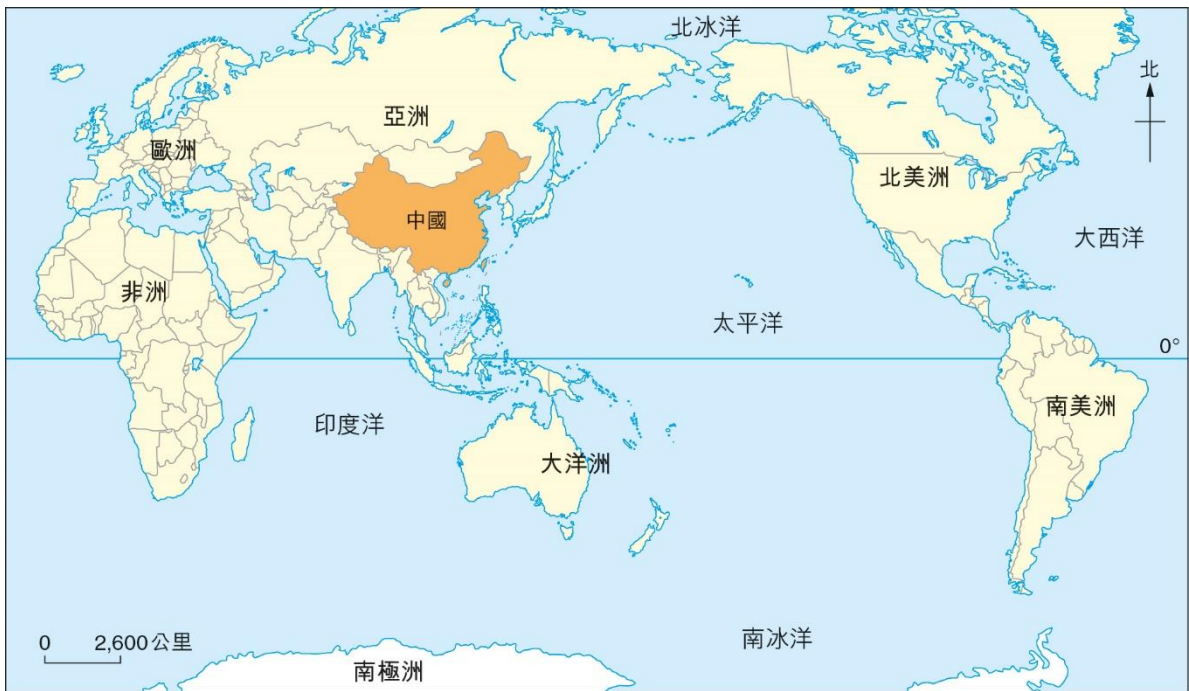
圖 1 中國的區位