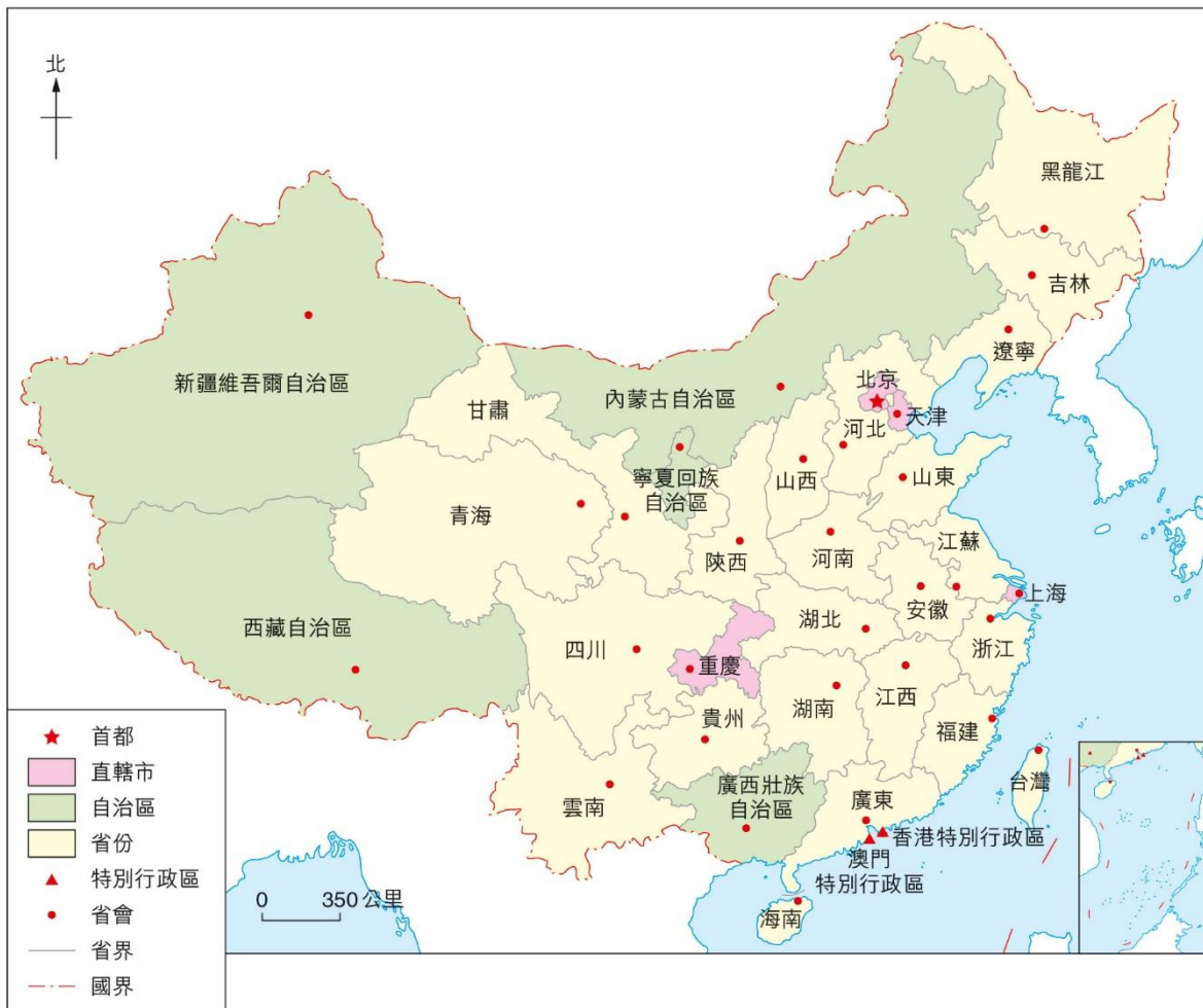
圖4 中國各行政區的區位