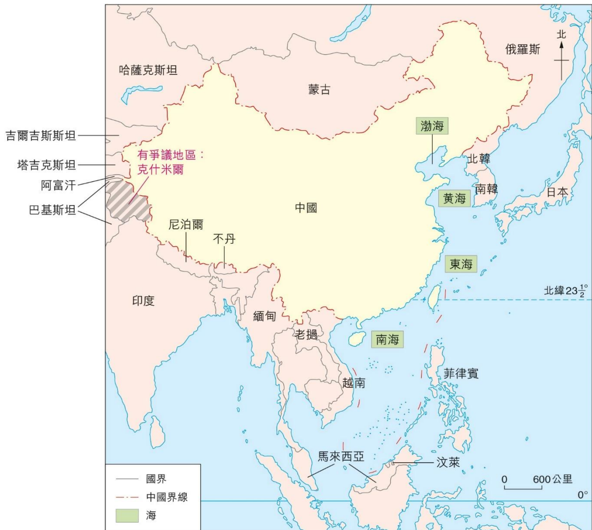
圖 3 中國的領土和鄰國