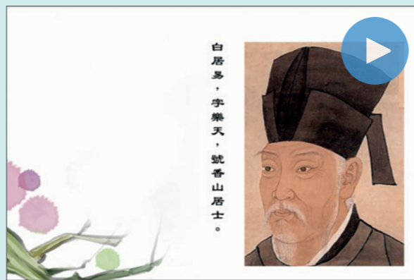
白居易，字樂天，號香山居士。