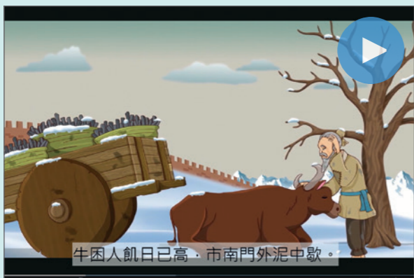
牛困人飢日已高，市南門外泥中歎。